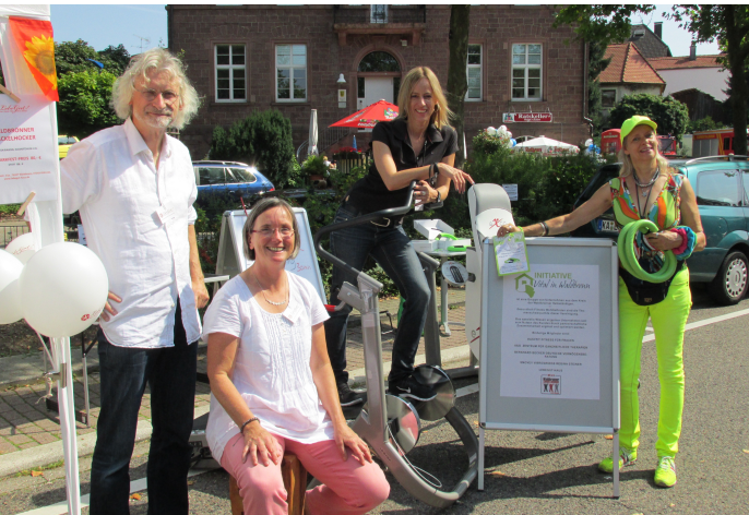
Einige der Mitglieder von „Vital in Waldbronn“.

Neu in diesem Jahr ist die „Treffpunkt-Lounge“: Wie auf einer Galerie sitzend dürfen die Besucher ihren Blick über den Marktplatz schweifen lassen und die einmalige Atmosphäre der Offerta genießen.