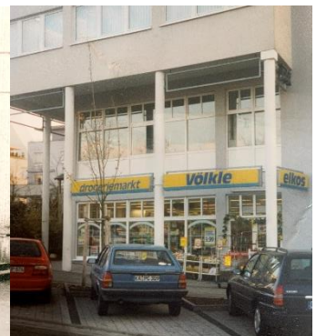
1991 elkos Drogeriemarkt Markt- und Drogeriemarkt Markt- und Drogeriemarkt