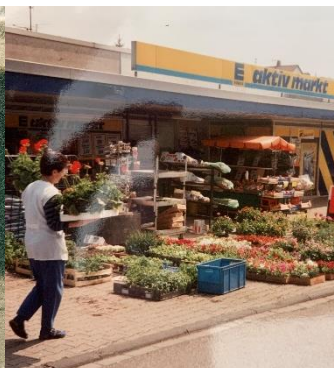
1970 Jägerweg 1 2. Generation an neuem Standort