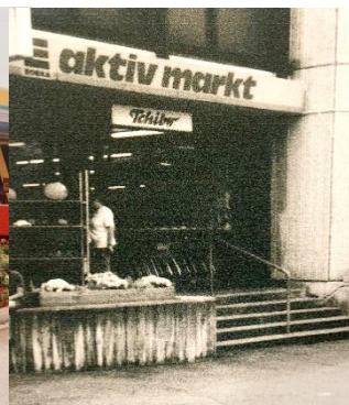
1980 Marktplatz 1 (heute: Studio Fit+)