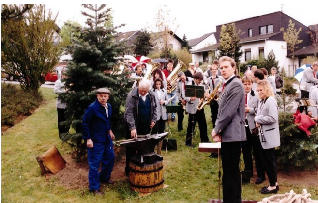
1989: Waldbronner Schmiedemeister spielen die Amboss-Polka.

Klempner, Glaser, Tischler und weitere Gewerke stehen. Wer sich die Wappen aus nächster Nähe anschauen möchte, ist herzlich eingeladen zum 30. Zunftbaumstellen.